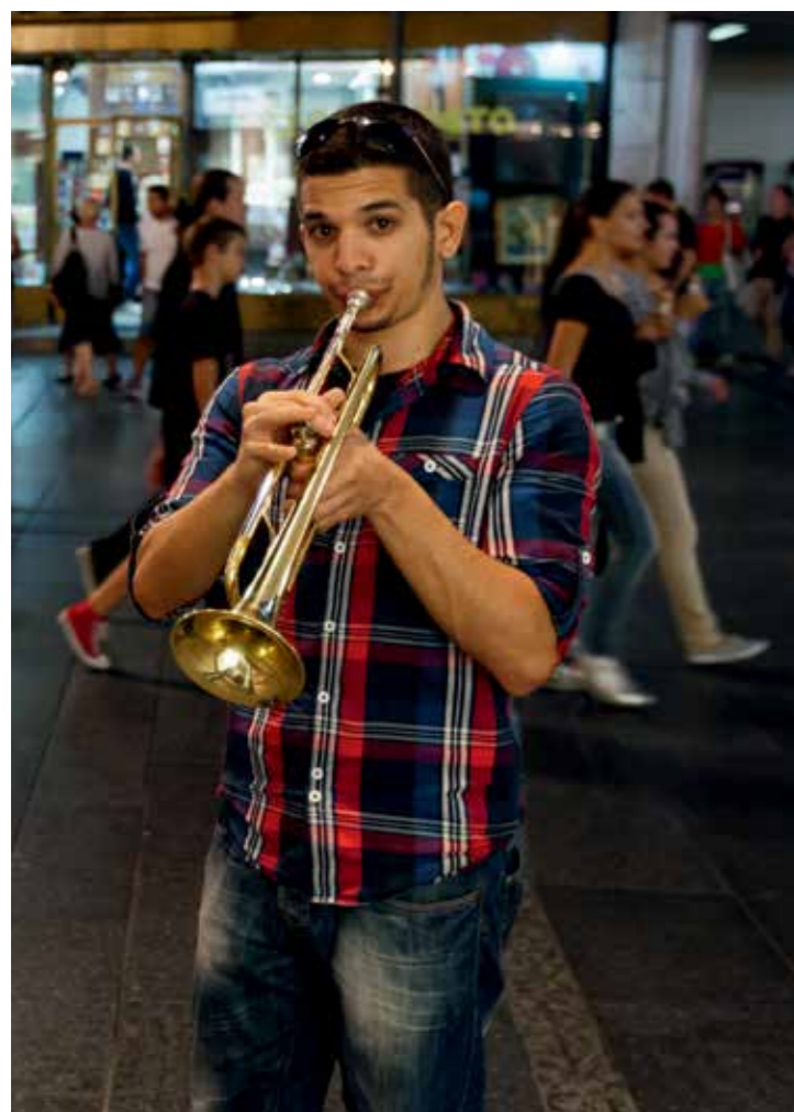
Млади музичар с тџубом у Кнез Михаиловој. Музиколози држе да је тџуба као симбол цеза за младе Београђане педесетих година ХХ века постојала популарна захваљујући њада културним филмовима.

Сџирене 20-21: Једно од џириџичких аџрација Калемеџана је необична џрађевина Велики или Римски бунар. Посејџиоци се сџиралним сџејеницама сџушџају у бунар џридесетџак мџџара. У ходницима џоред сџејеница увек се чује сџџурање ваздуха, „џоџемни ехо Беоџрада“.